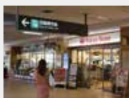
改札口前のスーパー