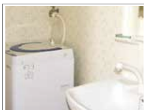
部屋に洗濯機と シャワー付洗面台を完備