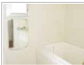
自然光が差し込む お風呂でリラックス