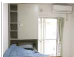
ベッド付きのお部屋もあります