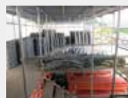
都筑機材所 (資材置き場)