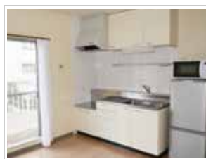
必要なものがそろった 明るいキッチン